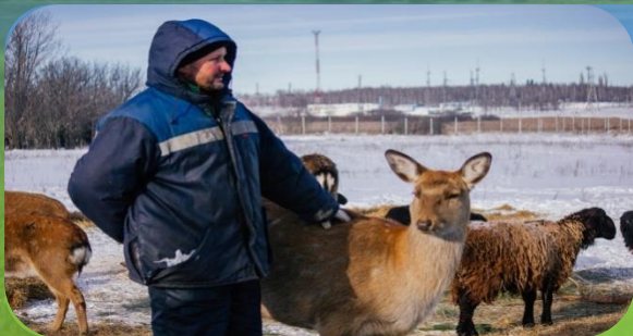
ЭКОПАРК «ОЛЕНИЙ ОСТРОВ»