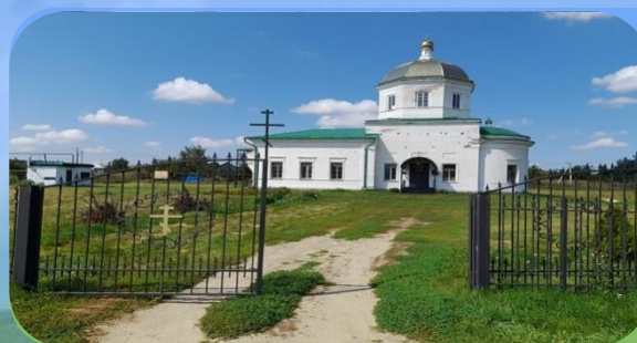
ПОДВОРЬЕ СВЯТО- НИКОЛЬСКОГО МУЖСКОГО МОНАСТЫРЯ