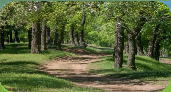
БОЛЬШЕИВАНОВ СКИЙ ПРИУСАДЕБНЫЙ ПАРК