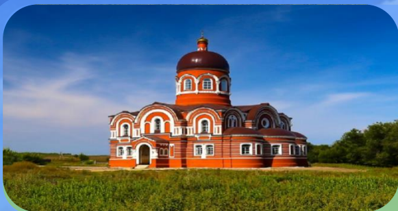
ХРАМ ПОКРОВА БОЖИЕЙ МАТЕРИ