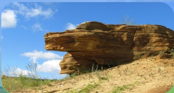
ПЕСЧАНЫЙ КАРЬЕР У ДОКТОРОВКИ