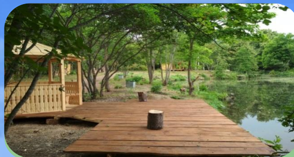
РЫБОЛОВНЫЙ КЛУБ «ФОРЕЛАНДИЯ»